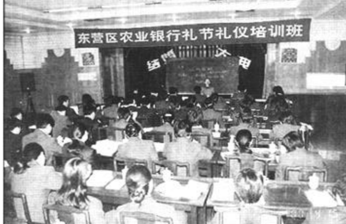
东营区农业银行为了给招商引资工作提供高效、优质的服务，对全体员工分期分批进行了礼节礼仪培训。

1973年3月，扎伊尔发生了叛乱，这对于远隔重洋的日本企业似乎没有多大的意义，但日本三菱公司的情报人员经过分析认为，扎伊尔的叛军很可能会向赞比亚移动，切断交通，而与扎伊尔相邻的赞比亚是世界上重要的铜矿生产基地，由此会影响到赞比亚铜矿的输出，从而影响世界上铜的价格，三菱公司果断作出决策，大量收购市场上的铜。后来，形势的发展果真如此，而此时市场上的铜价每吨上涨了60多英镑，三菱公司趁机将先期购进的铜卖出，着实很赚了一笔。从上我们可以看到，发现潜在商机需要具备战略眼光，打破常规，善于透过现象抓本质。在我们的现实生活中不乏此类实例。在我国的大庆油田开发初期，日本的企业家凭借我国对铁人事迹有关报道资料的分析，得出了大庆油田的具体位置、石油产量等情况，适时生产出了有关的石油开发设备，抢得了商机。其次，在全球石油危机端倪初露